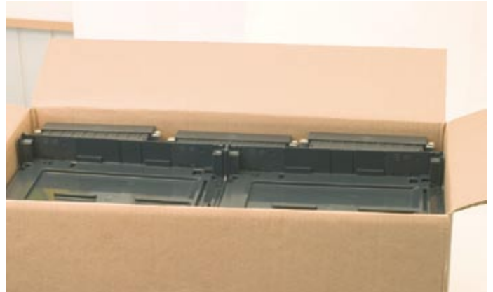
De onderbakken met het invoerstuk worden in een grootverpakking van twaalf stuks geleverd.

Door de gescheiden levering beschikt u op de bouwplaats direct over de onderbakken met invoerstukken. Dit scheelt u flink wat logistieke handelingen. Verschillende kastonderdelen scheiden en binnenwerken met deksels opslaan behoren namelijk tot het verleden. Ook bestellen per bouwnummer hoeft niet meer. U selecteert gewoon een aantal basisbinnenwerken en enkele standaardcomponenten. Vlak voor of tijdens de montage van de binnenwerken klikt u alle onderdelen eenvoudig samen tot het gewenste resultaat. Ook meerwerk realiseert u tot op het laatste moment in een klik.